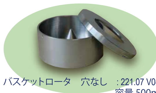
バスケットロータ 穴なし :221.07 V04 容量 500ml