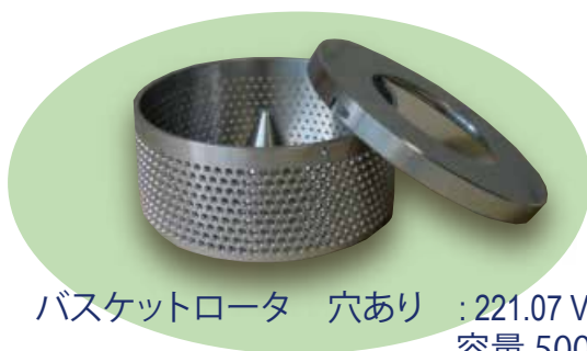
バスケットロータ 穴あり :221.07 V02 容量 500ml