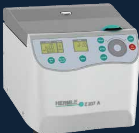
Compact Centrifuge Z 207 A