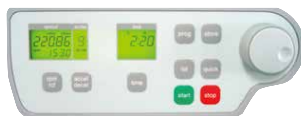
操作簡単、ホイルキーボードのコントロールパネル