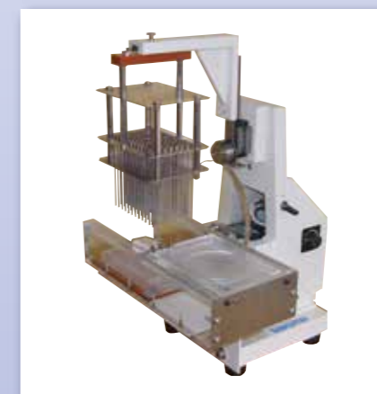
マイクロプランター MIT-96P