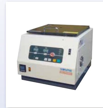
加熱式卓上遠心機 SL-IVDH