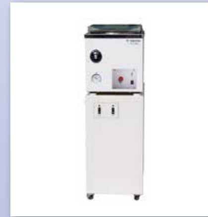
遠心エバポレータ EC100