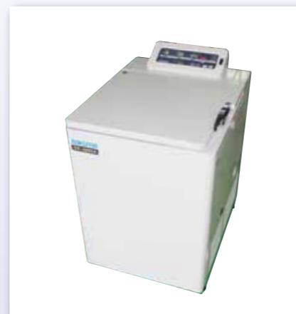
高速冷却遠心機 SS-2050S簡易防爆