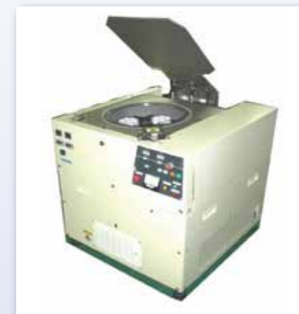
真空遠心多本架脱泡機 SVC-3000