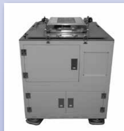
半導体向遠心乾燥機 SPD 個別仕様